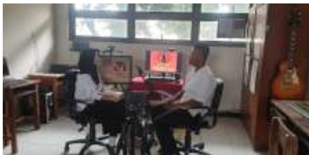
Gambar 3. Kelompo 2

Pelaksanaan Podcast Hari Kamis 12 Januari 2023