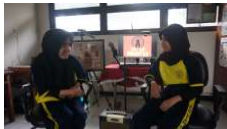
Gambar 4. Kelompok 3

Pelaksanaan Podcast Hari Kamis 12 Januari 2023