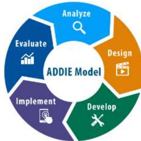
Gambar 1. Model Addie

artinya dari tahapan yang pertama sampai tahapan yang kelima dalam pengaplikasiannya harus secara sistematis dan tidak bisa diurutkan secara acak. Kelima tahap atau langkah ini sangat sederhana jika dibandingkan dengan model desain yang lainnya. Sifatnya yang sederhana dan terstruktur dengan sistematis maka model desain ini mudah dipahami dan diaplikasikan. (Sugiyono, 2015)