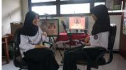
Gambar 2. Kelompok

Dilaksanakan pada hari Selasa 10 Januari 2023