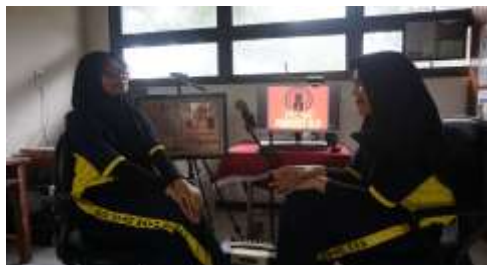
Gambar 5. Kelompok 4